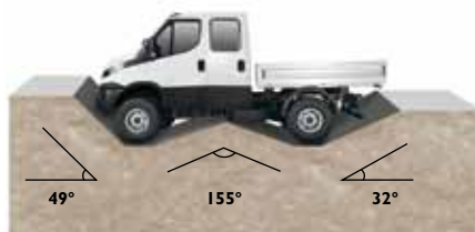
Böschungswinkel vorne Rampenwinkel Böschungswinkel vorne